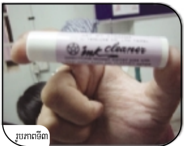
រូបភាពទី៣