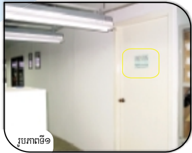
រូបភាពទី១

ការអនុវត្តន៍ល្អសំរាប់ការងារសំអាតស្នាមប្រឡាក់ បំបែកការងារសំអាតស្នាមប្រឡាក់ចេញពីកន្លែងផលិតកម្ម ដោយដាក់វាឱ្យនៅក្នុងបន្ទប់ដាច់ដោយឡែកមួយ (រូបភាពទី១) ។ ធានាថាបន្ទប់សំអាតស្នាមប្រឡាក់ មានខ្យល់អាកាសល្អគ្រប់ពេលទាំងអស់ តាមរយៈការបំពាក់កង្ហារ និងប្រព័ន្ធបិទខ្ទប់កខ្វក់ចេញពីបន្ទប់ (រូបភាពទី២) ។ កង្ហារនៅក្នុងបន្ទប់សំអាតស្នាមប្រឡាក់ មិនគួរបក់ចំដាក់កម្មករនោះទេ ព្រោះវាអាចធ្វើអោយកម្មករដកដង្ហើមស្រូបចូលនូវសារធាតុគីមី (រូបភាពទី២) ។ ត្រូវផ្តល់អោយកម្មករសំអាតស្នាមប្រឡាក់នូវសំភារៈ ការពារខ្លួន (PPE) ដូចជា ស្រោមដៃ វ៉ែនតាសុវត្ថិភាព ម៉ាស់ការពារ និងអាវអៀម ។ រោងចក្រជាច្រើនប្រើប្រាស់សារធាតុសំអាតស្នាមប្រឡាក់ ដែលមានជាតិ ទ្រីក្លរអេទីឡេន ។ ទ្រីក្លរអេទីឡេន គឺជាសារធាតុពុល ហើយអាចបង្កអោយមានគ្រោះថ្នាក់ធ្ងន់ធ្ងរ ។ ចំនុចសំខាន់ ត្រូវអោយកម្មករពាក់សំភារៈការពារខ្លួន (PPE) ដើម្បីការពារពួកគេកុំអោយប៉ះពាល់ ឬស្រូបសារធាតុគីមីនេះតាមការដកដង្ហើម (រូបភាពទី២ និងទី៣) ។ ធានាថាកម្មករត្រូវបានអប់រំវិធីប្រើប្រាស់សារធាតុគីមីយ៉ាងត្រឹមត្រូវ ។ សន្លឹកទិន្នន័យព័ត៌មានស្តីពីសុវត្ថិភាពគីមី (MSDSs) ត្រូវតែបានផ្តល់អោយជាភាសាខ្មែរ ។ ធានាថាកម្មករ និងបុគ្គលិកពេទ្យ ដឹងពីវិធីដែលត្រូវធ្វើក្នុងករណីដែលមានសារធាតុគីមីដែលគ្រោះថ្នាក់បានកំពប់ ឬពេលដែលកម្មករណាម្នាក់រងរបួស ។ ធានាថាកម្មករយល់ដឹងពីរបៀបទុកដាក់សារធាតុគីមីបានយ៉ាងត្រឹមត្រូវ ។