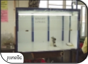
រូបភាពទី៤