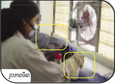
រូបភាពទី៣