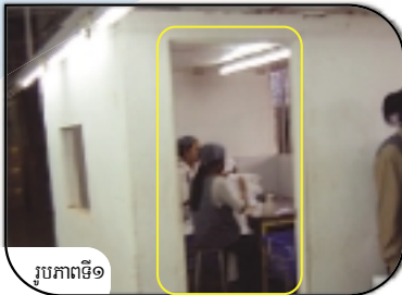
រូបភាពទី១