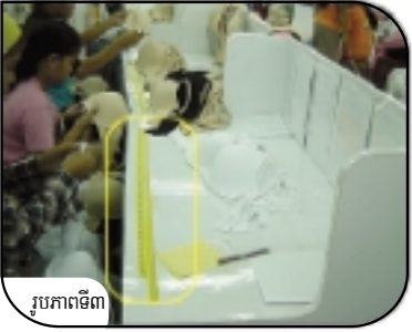
រូបភាពទី៣