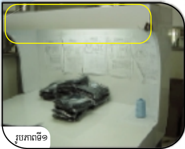
រូបភាពទី១

ការអនុវត្តន៍ល្អក្នុងការរៀបចំប៉ុស្តិ៍ពិនិត្យគុណភាព ធានាការផ្តល់ព័ន្ធអោយបានច្បាស់ ប៉ុន្តែពន្លឺដាច់ខាតមិនត្រូវជះចំភ្នែកកម្មករឡើយ (រូបភាពទី១) ។ ផ្តល់ការណែនាំការងារអោយបានច្បាស់លាស់ជាភាសា ដែលកម្មករអាចយល់ ដោយមានបង្ហាញជា រូបភាពផង បើចាំបាច់ (រូបភាពទី២) ។ ម៉ែត្រង្វាស់ត្រូវបិទភ្ជាប់នឹងតុការងារ ដើម្បីជំនួយដល់កម្មករនៅពេលពិនិត្យខ្នាតសំលៀកបំពាក់ ។ រង្វាស់ម៉ែត្រនេះ ត្រូវបិទជាប់ជាអចិន្ត្រៃយ៍ដើម្បីបង្ហាញពីខ្នាតផ្សេងៗរបស់សំលៀកបំពាក់ ដែលត្រូវពិនិត្យ (រូបភាពទី៣) ។