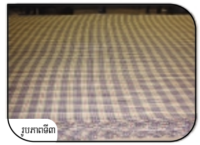
រូបភាពទី៣