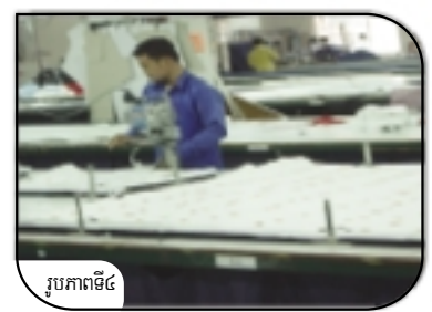
រូបភាពទី៤