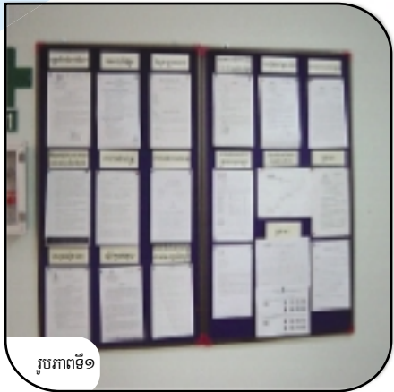
រូបភាពទី១

ការអនុវត្តន៍ល្អសំរាប់ការរៀបចំការខ្សែពតិមាន រក្សាការខ្សែពតិមានអោយបានស្អាត និងមានរបៀប (រូបភាពទី១) ។ យកពតិមានចាស់ៗចេញអោយបានញឹកញាប់តាមដែលអាចធ្វើទៅបាន ។ ដាក់ចំណងជើងលើការខ្សែពតិមានទៅតាមប្រធានបទ និងភាសាចំរុះ ។ កម្មករអាចរកពតិមានដែលគេត្រូវការបានរហ័ស និងងាយស្រួល (រូបភាពទី២) ។ ដាក់ការខ្សែពតិមាននៅទីតាំងដែលកម្មករងាយមើលឃើញ ។ ចាត់បុគ្គលិក (ឬក្រុមកម្មករ) អោយទទួលខុសត្រូវសំរាប់ការខ្សែពតិមានអោយបានស្អាតល្អមានរបៀបរៀបរយ និងប្រព័ន្ធពតិមានថ្មីៗ ។