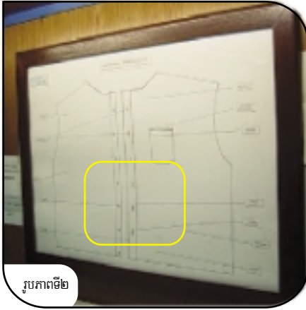
រូបភាពទី២