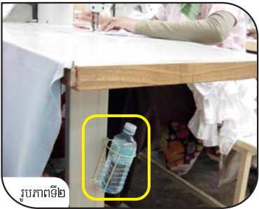
រូបភាពទី២