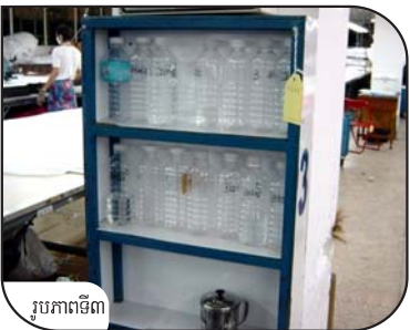
រូបភាពទី៣

អត្ថប្រយោជន៍: ✓ ជួយដល់កម្មករឱ្យមានថាមពលក្នុងអំឡុងពេលធ្វើការងារច្រើនម៉ោងក្នុងមួយថ្ងៃ ព្រមទាំងលើកស្ទួយផលិតភាព ✓ បន្ថយបន្ថយការហត់ឡើយ និងជំងឺការងារ ដូចជាការសន្លប់ ✓ ស្ថានភាពសុខភាពរបស់កម្មករដែលល្អប្រសើរឡើងនឹងឈានដល់ការកាត់បន្ថយភាពអវត្តមាន