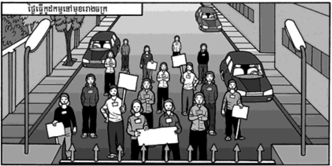
ថ្លៃធ្វើក្នុងកម្មនៅមុខរោងចក្រ

ជឿខ្ញុំបន្តិចទៅបានទេប្អូនស្រី កាលណា មានក្នុងកម្ម វាស្រេចលើខ្ញុំទេ ជាអ្នកបញ្ឈប់វា អ្នកគ្រប់ គ្រងនឹងឃើញថាខ្ញុំមាន ឥទ្ធិពលលើពួកគេ និងខ្លាច យើងនិងគោរពយើង ថ្លៃសុក្រយើងនឹងធ្វើ ក្នុងកម្ម