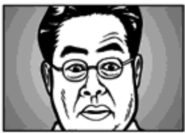
ពីរបីនាទីក្រោយមក អ្នកទាំងអស់ជុំគ្នាដើម្បីមើលខ្សែអាត់វីដេដូ