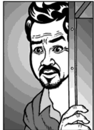
ពេលរសៀលនៅក្នុងរោងចក្រ