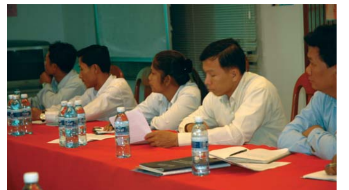
កិច្ចប្រជុំសហជីពដែលប្រព្រឹត្តទៅនៅរោងចក្រកាត់ដេរតែប្រសើរកាលពីថ្ងៃទី ៩- កញ្ញា-២០០៨

លោកជំទាវ រដ្ឋមន្ត្រី មានប្រសាសន៍ថា ដោយមើលឃើញពីការ រួមចំណែកយ៉ាងសំខាន់របស់ស្ត្រីនៅក្នុងសេដ្ឋកិច្ចជាតិ ក្រសួងកិច្ចការនារី បានផ្តួចផ្តើមអោយមានកម្មវិធីជាច្រើនដែលមានគោលបំណងផ្តល់ការគាំទ្រ និងការពារសិទ្ធិរបស់ស្ត្រី សហការជាមួយនិងក្រសួងដែលពាក់ព័ន្ធសំខាន់ៗ ដើម្បីលើកកម្ពស់អោយមានកម្មវិធីបណ្តាញសុវត្ថិភាពសង្គម (ដូចជា នៅក្នុង ទីផ្សារក្រៅប្រព័ន្ធ និងសំរាប់អ្នកដែលប្រកបរបរដោយខ្លួនឯង) និងតស៊ូមតិ អោយមានសមភាពក្នុងការងារ ដែលសុទ្ធតែជាការរួមចំណែកនៅក្នុងការ អភិវឌ្ឍន៍សេដ្ឋកិច្ច និងសង្គមជាទូទៅ។ ក្រសួងបានចូលរួមនៅក្នុងយុទ្ធនាការ លើកកម្ពស់តំលៃរបស់ស្ត្រី តាមរយៈការប្រកួតប្រជែងនិងទទួលបានជ័យជម្នះ និង រចនាមូលដ្ឋានសំលៀកបំពាក់ដែលរៀបចំឡើងដោយ រោងចក្រកាត់ដេរតែប្រសើរនៅ កម្ពុជា (BFC) និងដៃគូរបស់គំរោងនេះ។ ការប្រកួតប្រជែងនេះ មានគោល បំណងបង្ហាញអំពីការចូលរួមចំណែកយ៉ាងសំខាន់របស់កម្មករនិយោជិតកាត់ដេរ ចំពោះប្រទេសកម្ពុជា និងផ្តល់អោយកម្មករនិយោជិត នូវឱកាសដឹងពីសមត្ថភាព ច្នៃប្រឌិត និងទេពកោសល្យរបស់ពួកគេ។