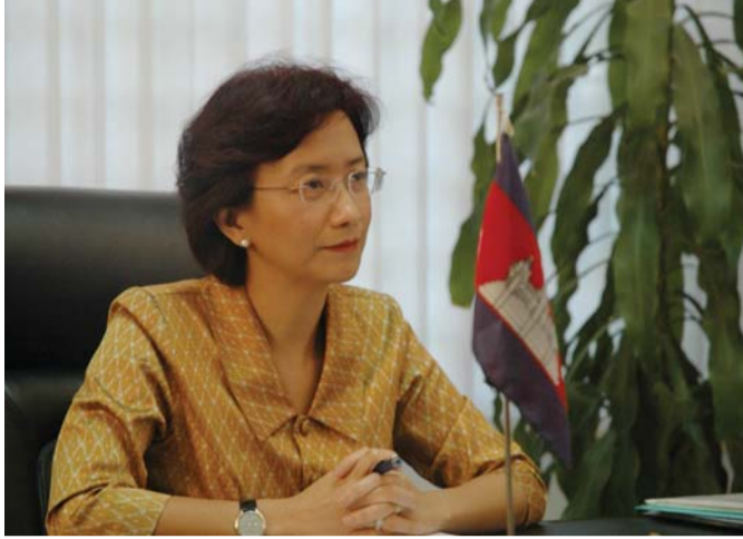
លោកជំទាវវេជ្ជបណ្ឌិត អ៊ឹង កន្ថាធាវី រដ្ឋមន្ត្រីក្រសួងកិច្ចការនារី

រដ្ឋមន្ត្រីក្រសួងកិច្ចការនារី លោកជំទាវ វេជ្ជបណ្ឌិត អ៊ឹង កន្ថាធាវី ជឿថា លក្ខខណ្ឌការងាររបស់កម្មករនិយោជិតកាត់ដេរនៅតែបន្តមានការរីកចម្រើន ហើយវិស័យកាត់ដេរនៅតែជាវិស័យនាំចេញឈានមុខគេសំរាប់ប្រទេសកម្ពុជា ដោយបង្កើតនូវការងារយ៉ាងច្រើនអនេក សំរាប់យុវជនយុវនារីខ្មែរ បើទោះបីជា មានការរុញយូរយារនៅពេលដែលការដាក់កំហិតរបស់សហរដ្ឋអាមេរិកលើ ប្រទេសចិន និងផុតកំណត់នៅបំណាច់ឆ្នាំនេះក៏ដោយ។