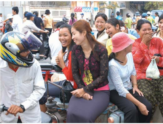
កម្មករនិយោជិតធ្វើដំណើរទៅធ្វើការនៅរោងចក្រមួយក្បែរភ្នំពេញ

នឹងធ្លាក់ចុះ ធ្វើអោយពួកគេកាន់តែឈឺចង់ជាងមុន និងញឹកញាប់ជាងមុន ពួកគេចាំបាច់ត្រូវចំណាយលុយលើការព្យាបាល និងសុំច្បាប់ឈប់សំរាកឈឺ ធ្វើអោយជីវិតសេដ្ឋកិច្ចកាន់តែធ្លាក់ចុះជួនដាប។ ទីពីរ នៅពេលដែលកម្មករ និយោជិតដែលមានជំងឺ ក្លាយជាគំរូលំដាប់កម្មករដែលមិនសូវមានផលិតភាព វិបត្តិសុខភាពនៅក្នុងតួចៗបែបនេះ មានឥទ្ធិពលលើសេដ្ឋកិច្ចរបស់ប្រទេស ដោយសារផលិតភាពនៅក្នុងវិស័យកាត់ដេរមានការធ្លាក់ចុះ។