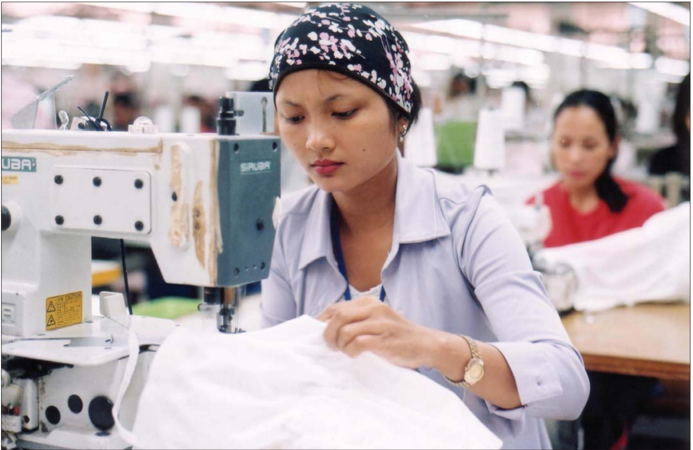
ភាគច្រើននៃកម្មករនិយោជិតកាត់ដេរកម្ពុជា ជាស្ត្រីក្មេងៗដែលមកពីតំបន់ជនបទក្រីក្រ

រោងចក្រកាន់តែប្រសើរនៅកម្ពុជា នៃអង្គការពលកម្មអន្តរជាតិ (ILO BFC) បានផ្តួចផ្តើមអោយមានសកម្មភាពចំនួន ២ ដើម្បីដោះស្រាយបញ្ហា ទាំងនេះ។ ទីមួយ ពិនិត្យលើបទពិសោធន៍ដែលកម្មករនិយោជិតកាត់ដេរមាន ពាក់ព័ន្ធជាមួយនឹងការផ្លាស់ប្តូរសេដ្ឋកិច្ចដ៏ធំរបស់សេដ្ឋកិច្ច និងទីពីរ បង្កើត អោយមានជាវេទិកាមួយ ដើម្បីពិភាក្សា និងសំរេចសំណុំលក្ខន្តិកៈនានាដែលផ្តល់ ជាការការពារ ឬ ជំនួយអោយកម្មករនិយោជិតកាត់ដេរ។ សកម្មភាពទីមួយ